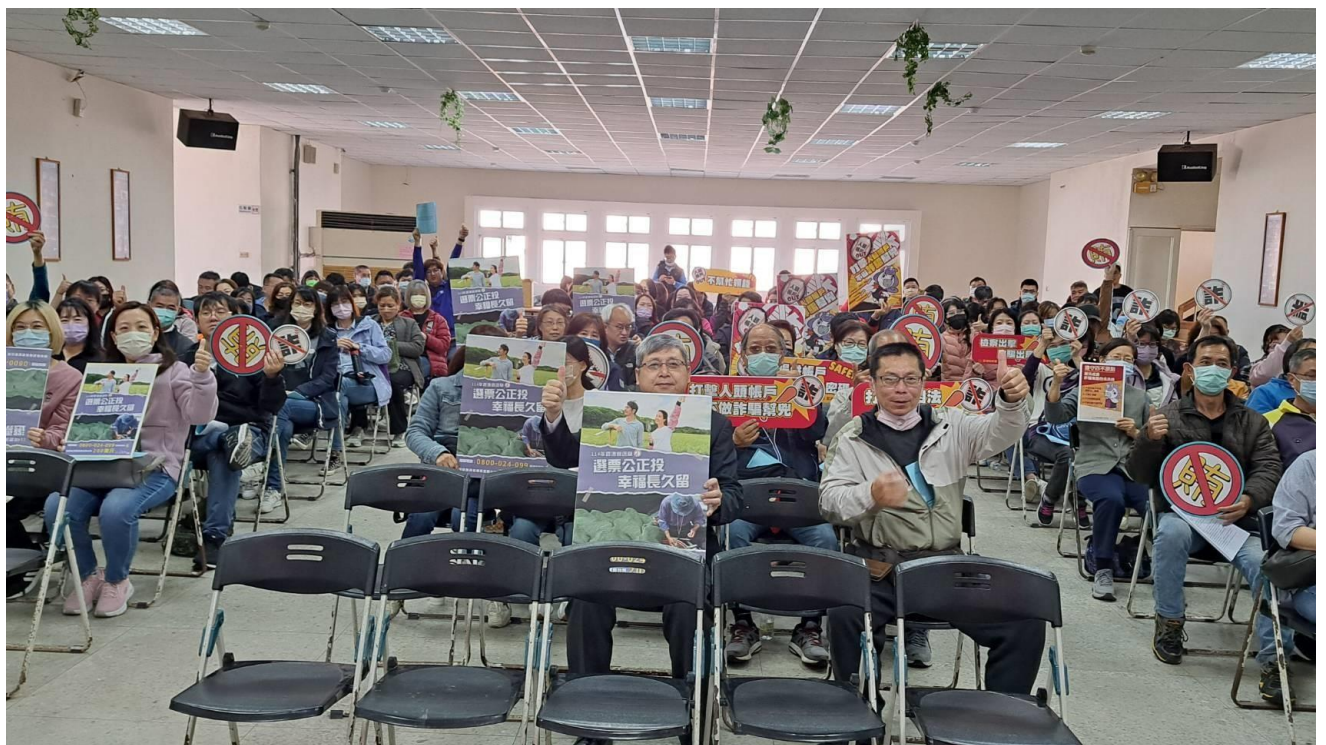
在場「反賄、反詐守門員」熱情支持澎湖地檢署查賄、打詐作為。