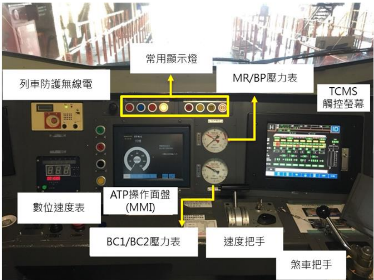
圖 3.4.1-1 普悠瑪列車駕駛台