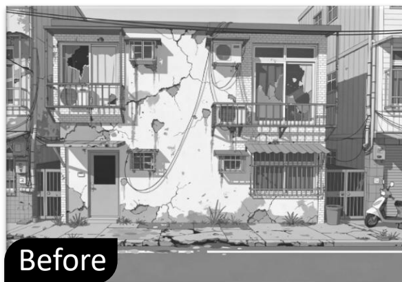
外牆磁磚掉落影響公安