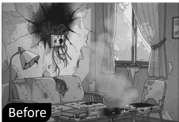
老舊管線致災風險