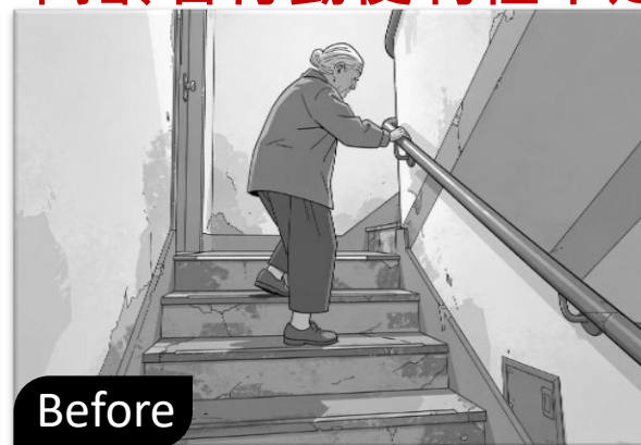
高齡者行動便利性不足