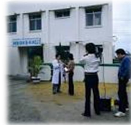
澳底群體醫療中心