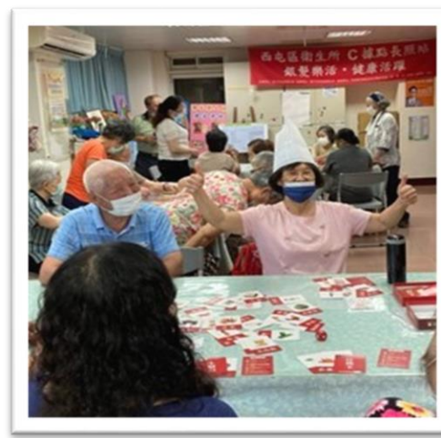
臺中市西屯區衛生所C據點長照站