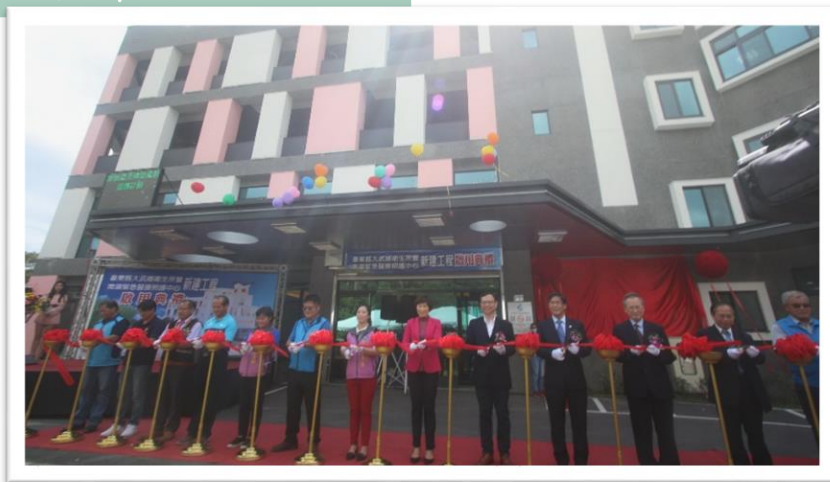
大武鄉衛生所暨南迴線緊急醫療照護中心新建案