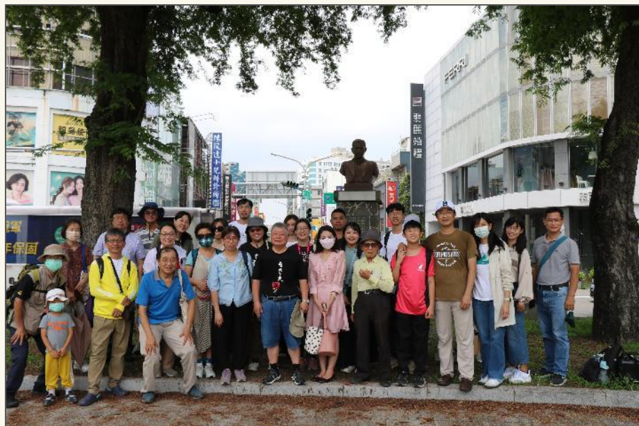
補助臺南市社區大學研究發展學會開設「記憶與遺忘」、「南方策展學」兩門課程