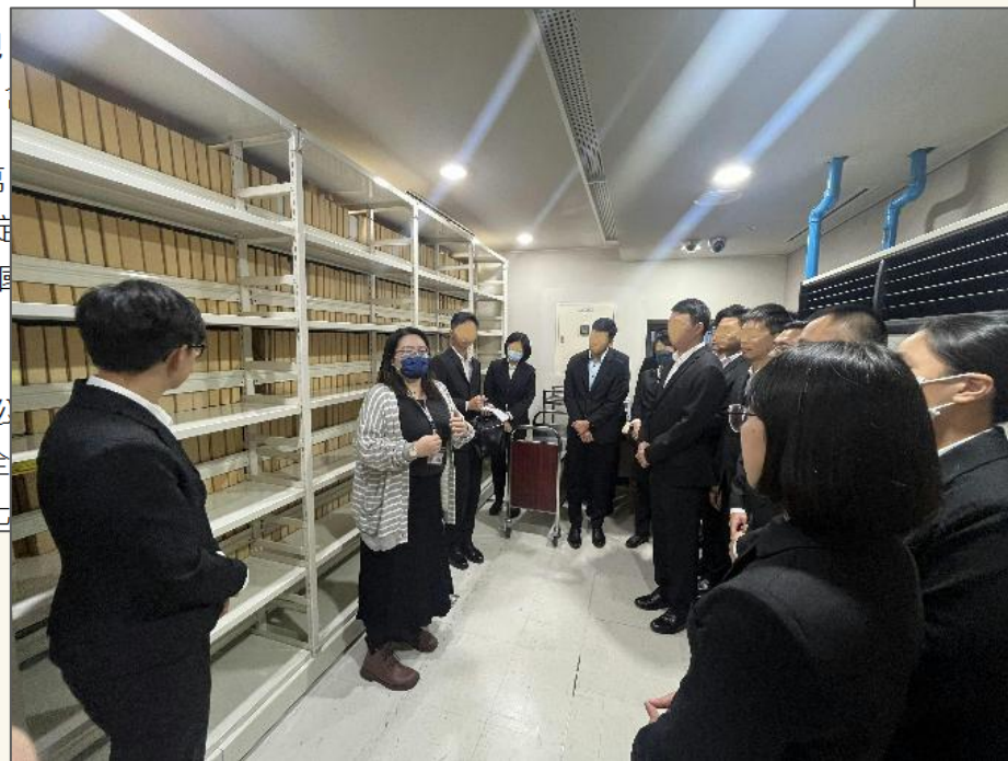
上圖：國安局115年2月23日將審定的5萬1,133件政治檔案全面解密移交國發會檔案局

國安局已將前述81年以前政治檔案全數解密，並依規定公箱，連同電子影像檔分批送交國發會檔案局，並於今日全保防安全工作制度、情報機關偵保防業務資料、反動文化