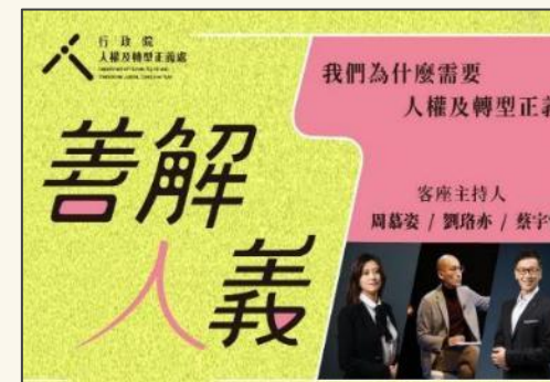
行政院人權及轉型正義處製播「善解人義—我們為什麼需要人權及轉型正義」Podcast節目