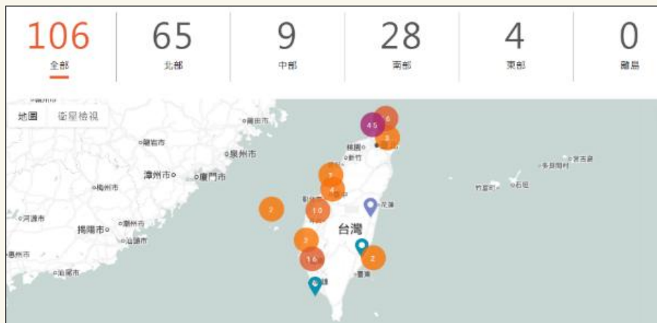
建置不義遺址資料庫，簡介全臺106處不義遺址，分享國小、國中、高中教案及教具箱