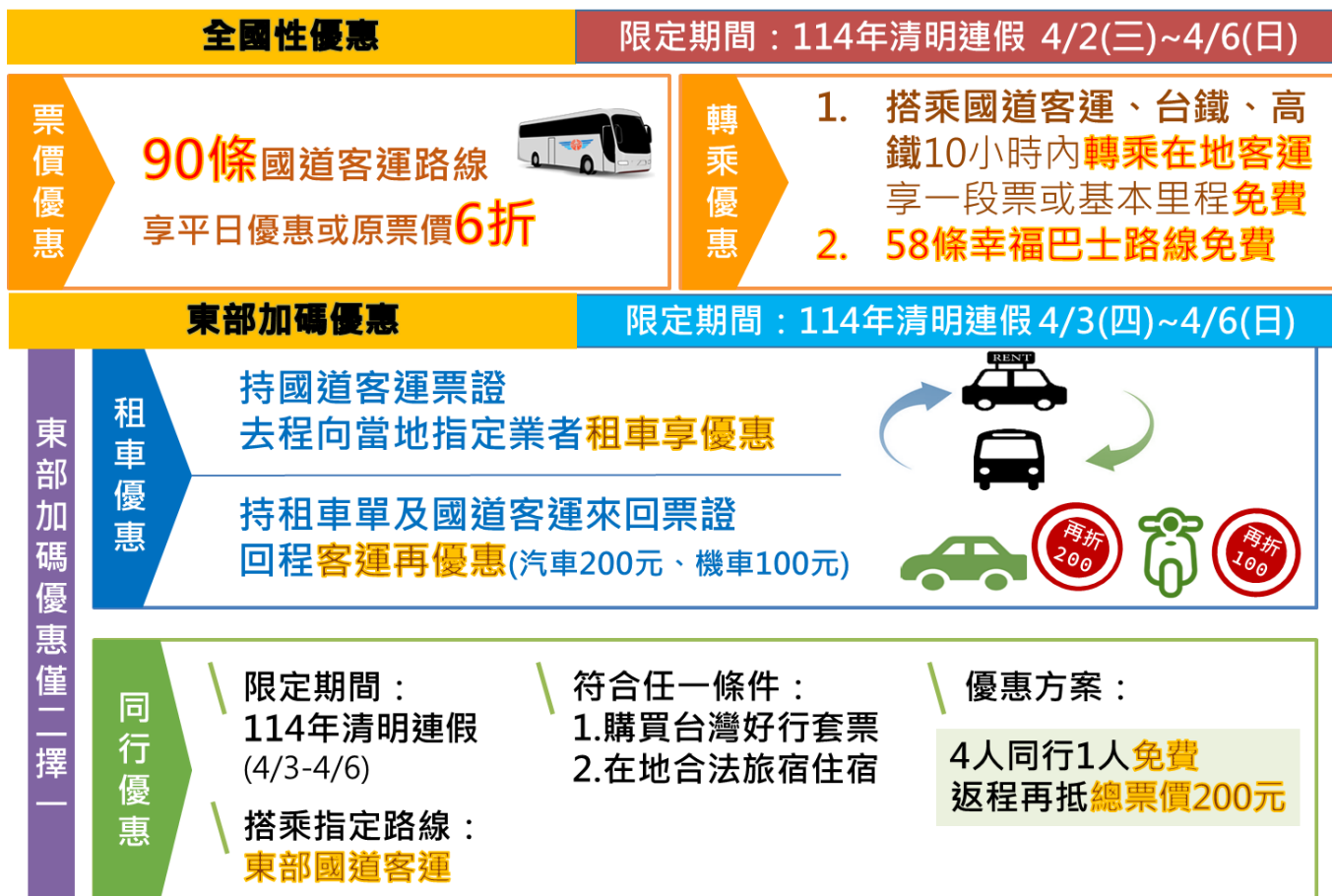
圖 3、國道客運優惠措施