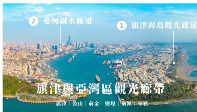
高雄市政府 「灣區大港 旗津領航」