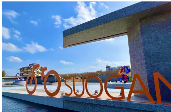
澎湖璀璨明珠-澎南自行車休憩站