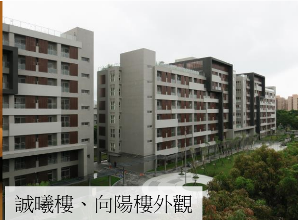
誠曦樓、向陽樓外觀