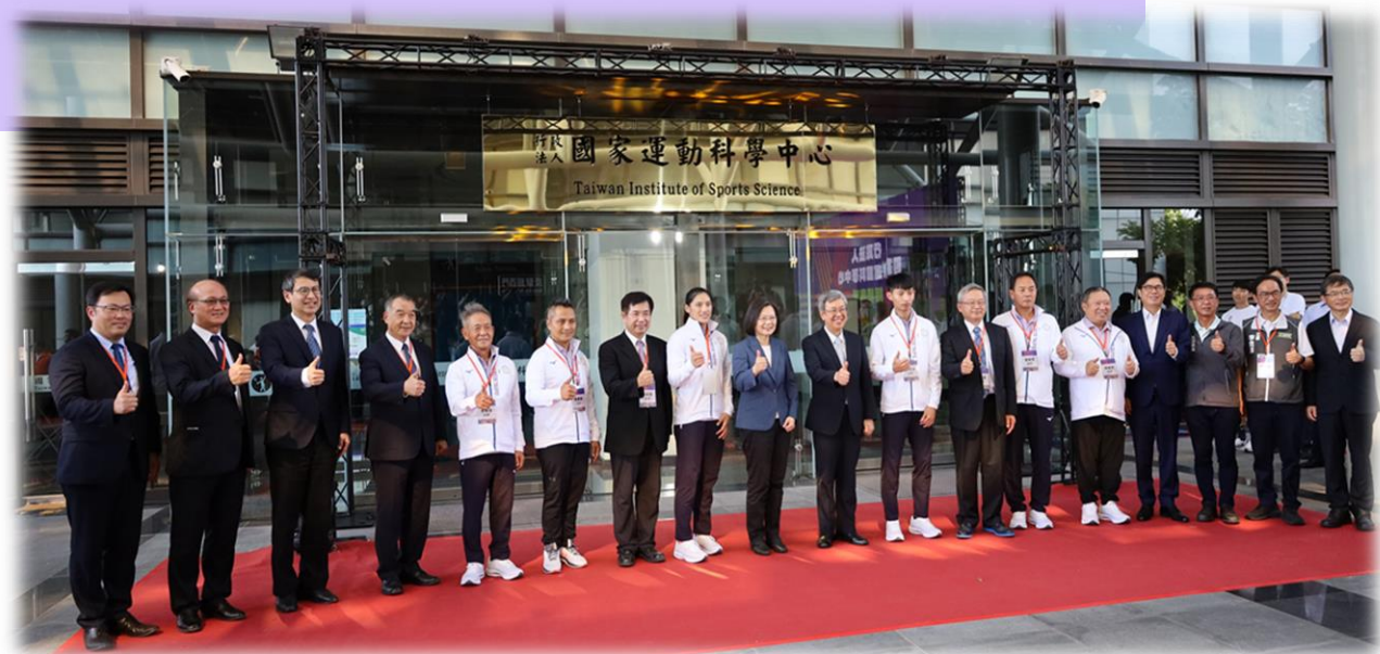
蔡英文總統及行政院陳建仁院長為行政法人國家運動科學中心揭牌。 112.9.16