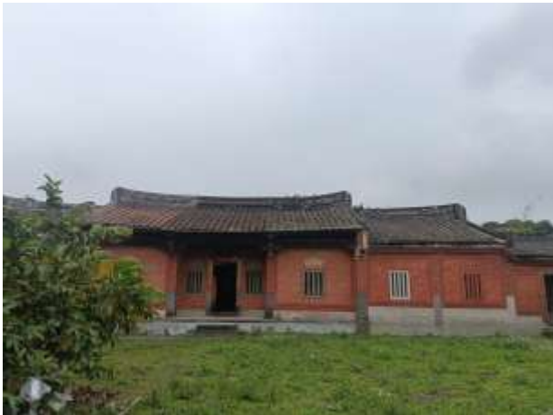
原國防部保密局桃園感訓所(徐厝)