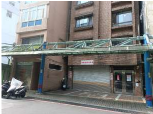
原臺灣省保安司令部軍法處看守所 新店分所