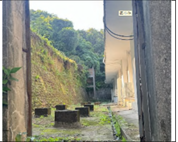
六張犁看守所後方守望哨