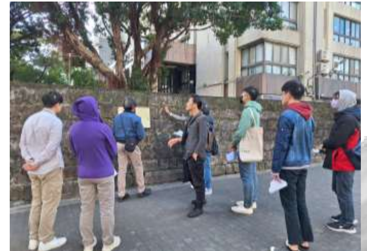
「不義遺址標示牌設置」現勘情形