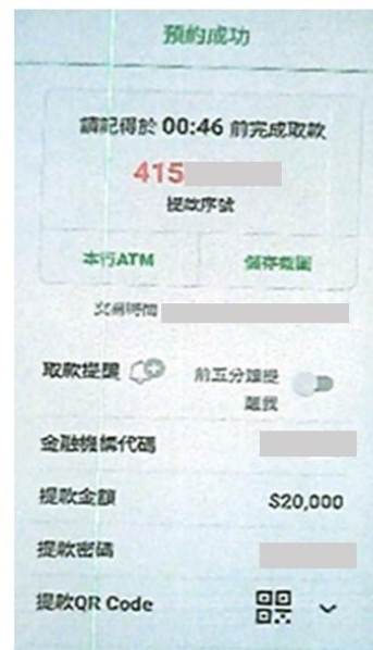
▲ 歹徒要求被害人翻拍無卡提款畫面