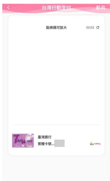
▲ 手機直接截圖呈現空白

策。另提醒民眾，遇要求提供付款碼、無卡提款 QR Code 或操作金融功能時，務必「冷靜 3 秒、多方查證」，切勿依指示操作。如有疑問，請撥打 165 反詐騙專線或至 165 打詐儀錶板查詢相關案例。