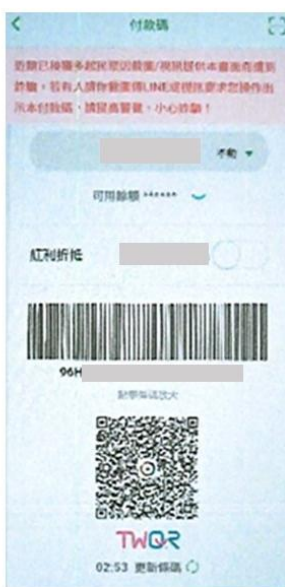
▲ 歹徒要求被害人翻拍TWQR