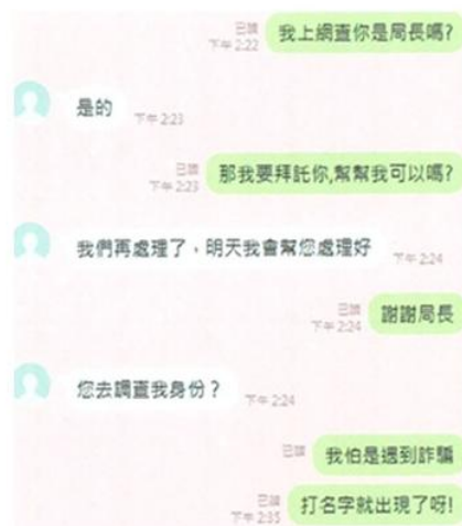
▲ 被害人與假金管會對話