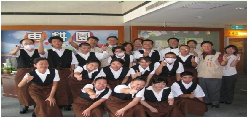
嘉義市身心障礙綜合園區一再耕園OT案