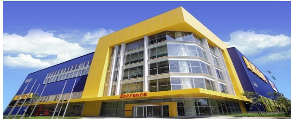
臺中市81公有市場用地BOT案 - 國泰人壽保險股份有限公司