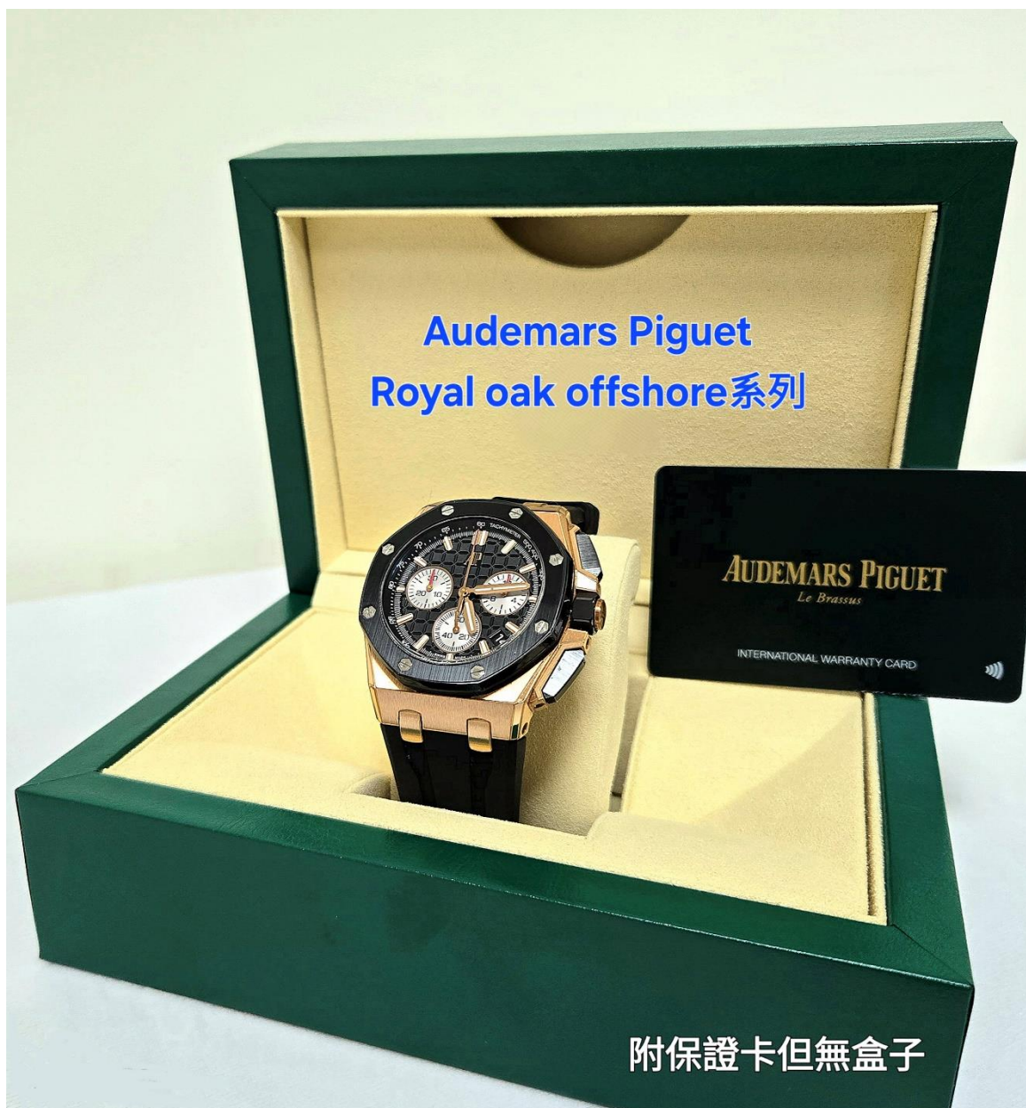
▲Audemars Piguet 愛彼手錶 (Royal Oak Offshore 系列)