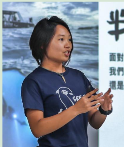
台灣保育，鏈結世界