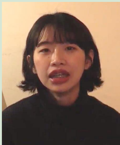
光影邂逅：捷克文學 與電影之產業交流