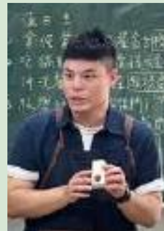
丹麥家具產業見學： 家具設計製造與木材 利用的關聯探究