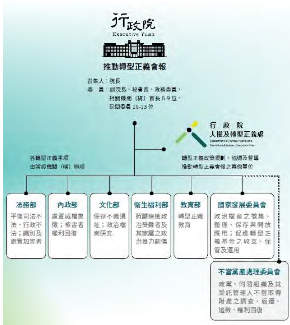
跨部會推動現況圖

在部會層次，主要由 6 部會 ( 法務部、內政部、文化部、教育部、衛福部、國發會 ) 分工辦理轉型正義各項工作，此外另有一獨立機關——不當黨產處理委員會 ( 下稱黨產會 )，負責不當黨產之調查、返還與收歸國有。