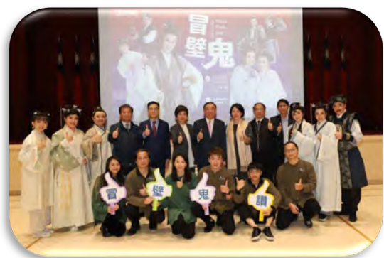
戲說人權—《冒壁鬼》海報及活動照