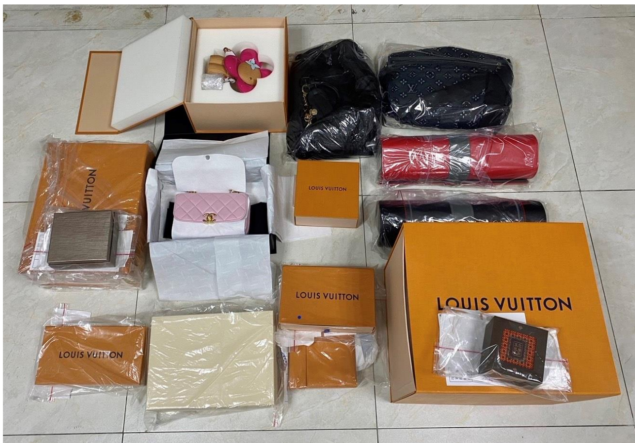
調查人員在搜索現場扣押之精品