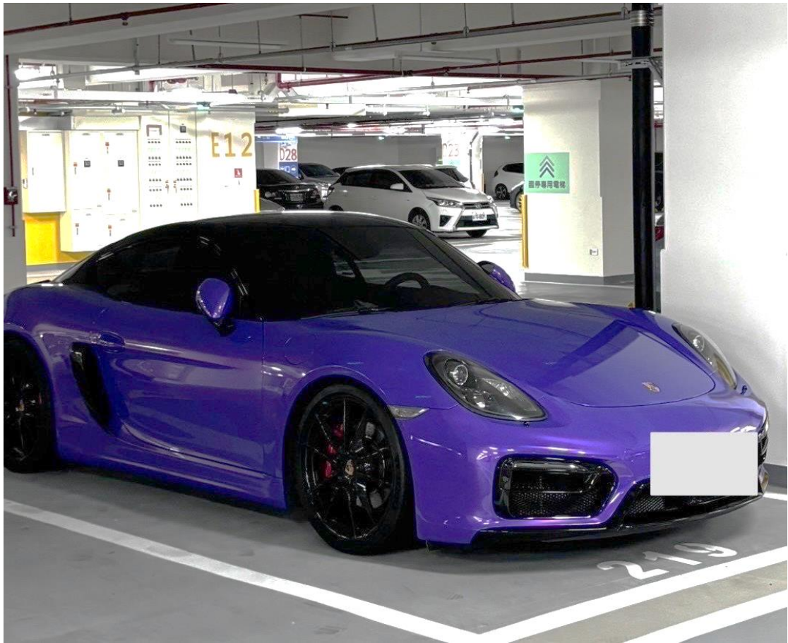
調查人員查扣 PORSCHE 跑車 1 部 (市價 1,500 萬元)