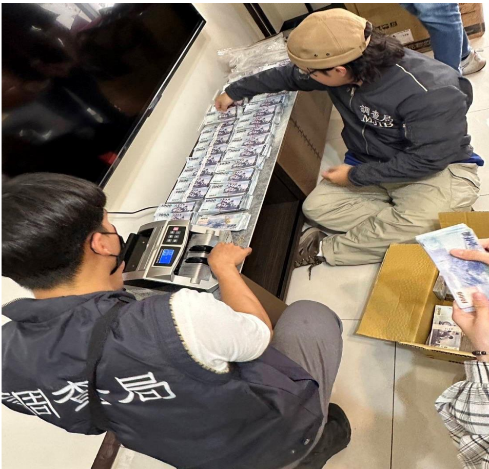
調查人員在搜索現場清點扣押現金