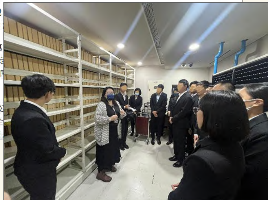
上圖：國安局115年2月23日將審定的5萬1,133件政治檔案全面解密移交國發會檔案局

國安局已將前述81年以前政治檔案全數解密，並依規定公箱，連同電子影像檔分批送交國發會檔案局，並於今日全保防安全工作制度、情報機關偵保防業務資料、反動文化