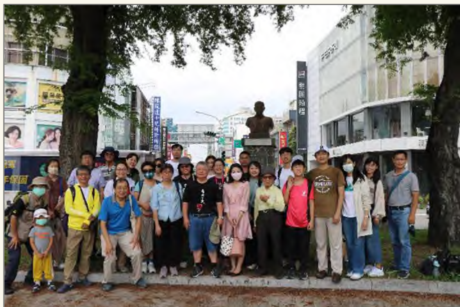
補助臺南市社區大學研究發展學會開設「記憶與遺忘」、「南方策展學」兩門課程