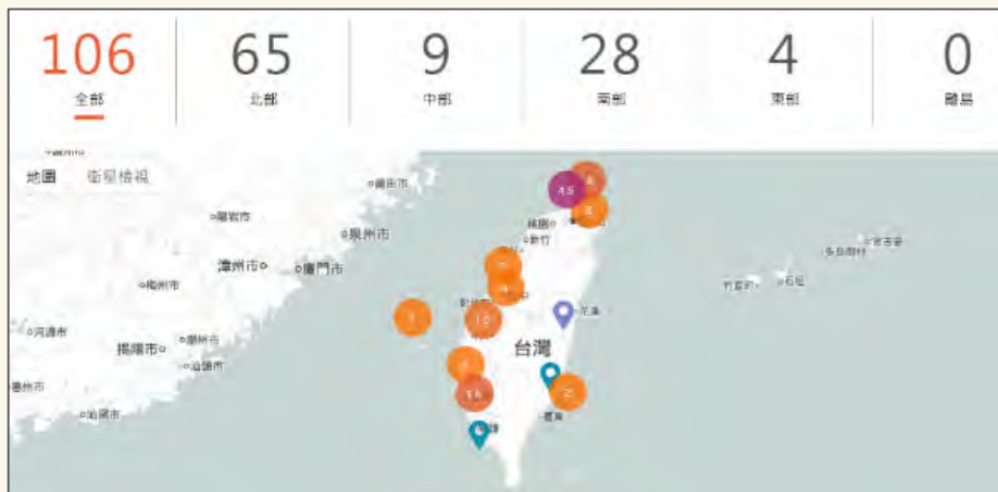
建置不義遺址資料庫，簡介全臺106處不義遺址，分享國小、國中、高中教案及教具箱