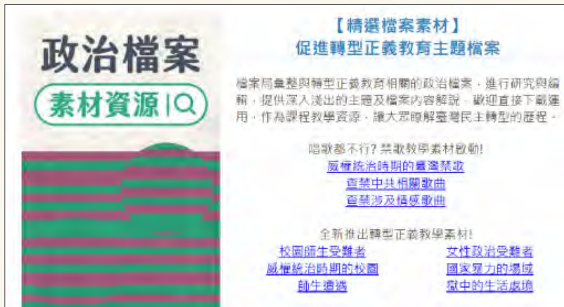
建置檔案教學支援網，設置政治檔案素材資源專區對外提供應用