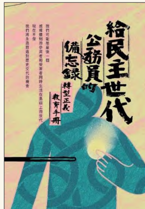
行政院出版轉型正義教育手冊，作為研習資源