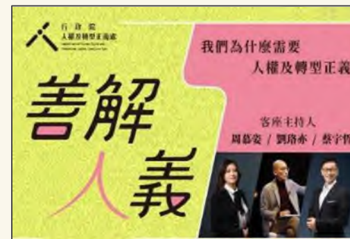
行政院人權及轉型正義處製播「善解人義—我們為什麼需要人權及轉型正義」Podcast節目