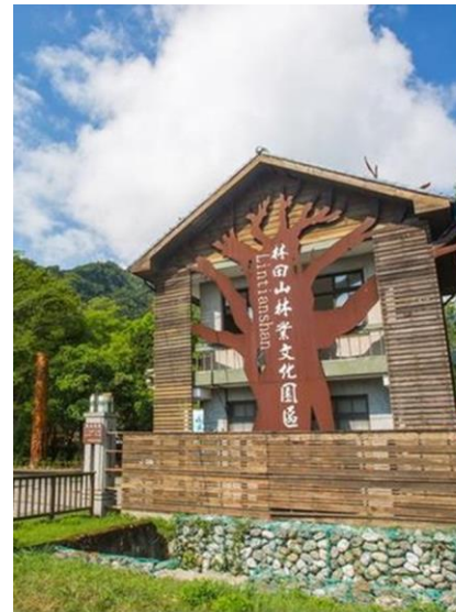
推動林田山林 場回復為原住 民保留地