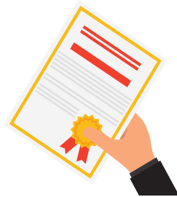
族語認證 結合工作權