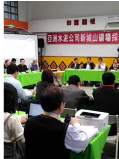
推動亞泥新城 山礦場三方會 談