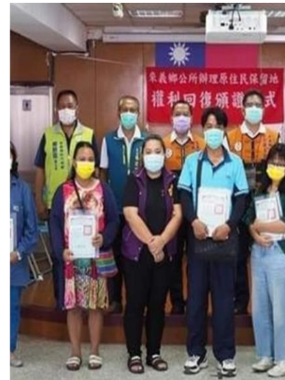
解決屏東縣來 義電塔40餘年 土地補償問題