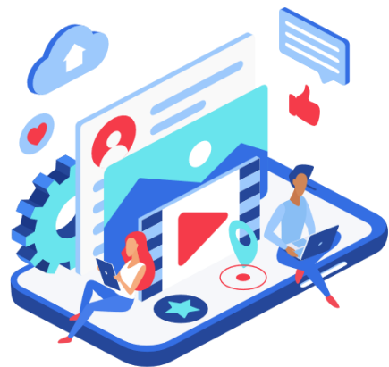
設置原住民 專屬媒體