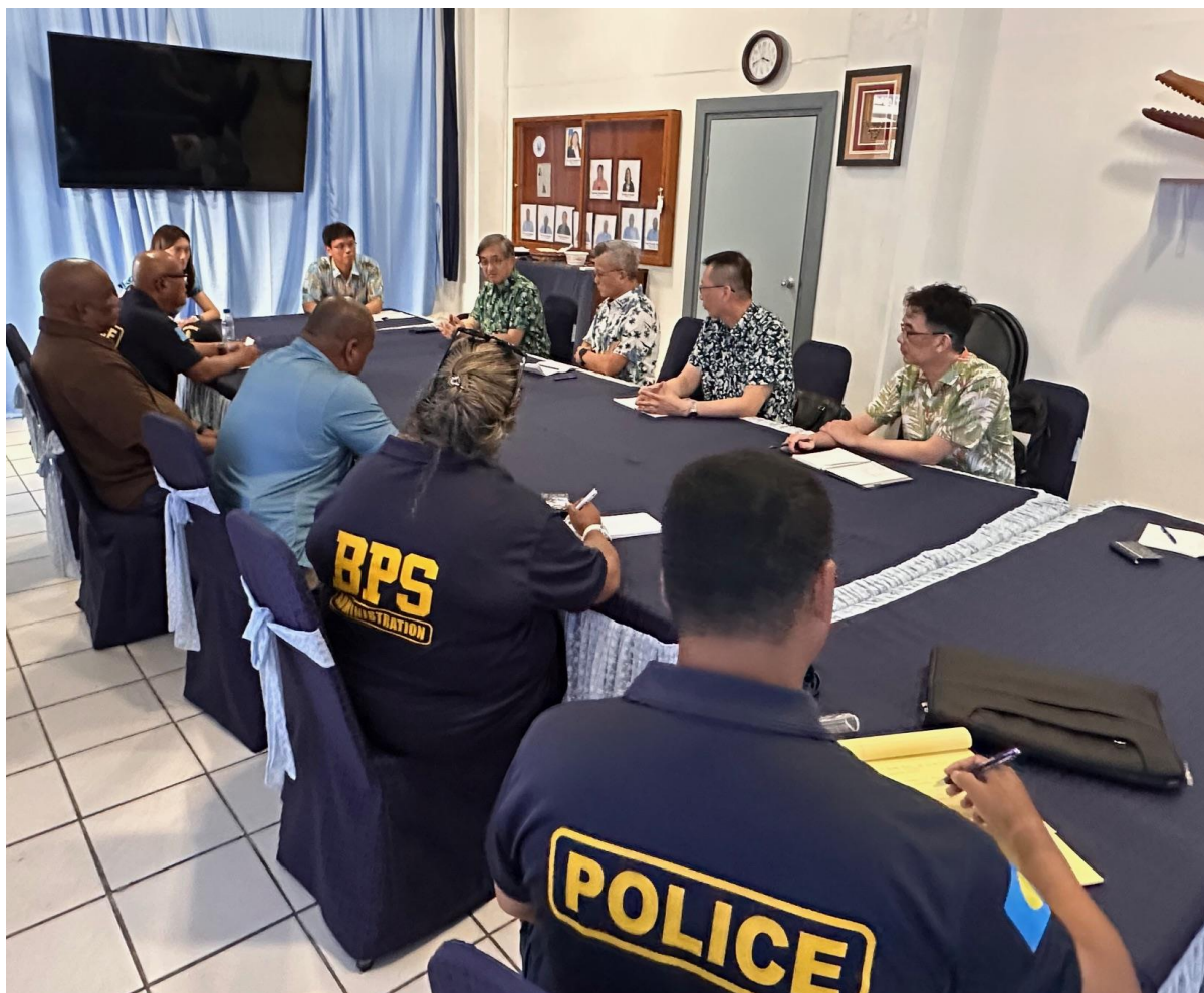
陳白立局長及調查局人員與帛琉司法部公安局進行執法合作經驗交流