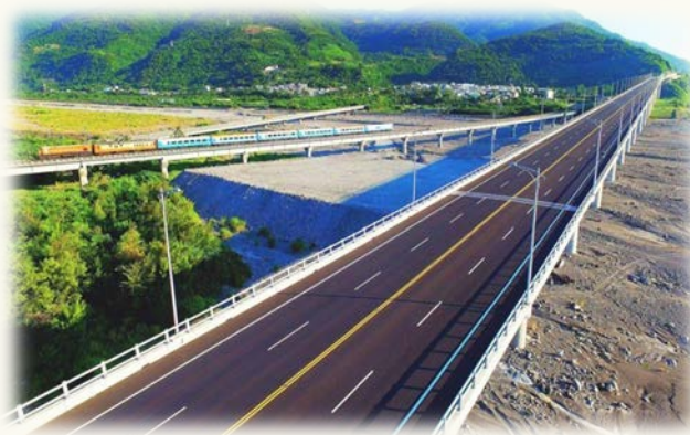
台9線南迴公路拓寬改善