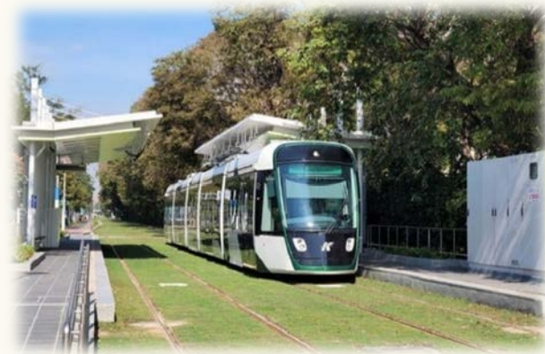
高雄捷運環狀輕軌大南環路段工程