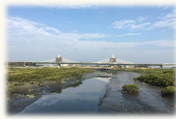
西濱快速公路(新豐至鳳鼻隧道段)