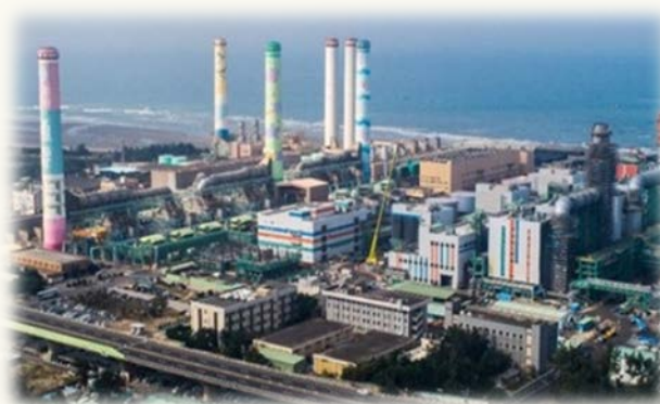
通霄電廠(3號機商轉)