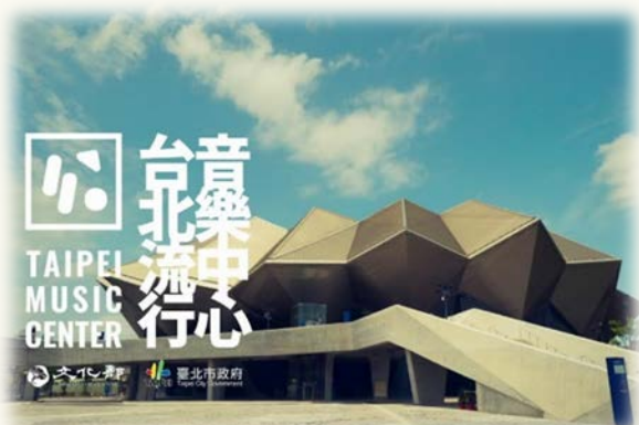
臺北流行音樂中心