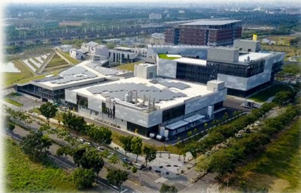
綠能科技示範場域實驗大樓