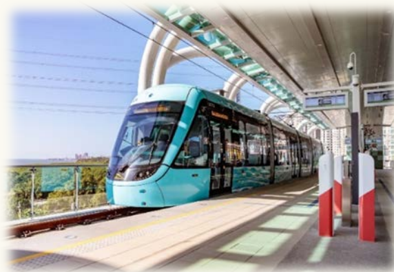
淡海輕軌藍海線第1期工程