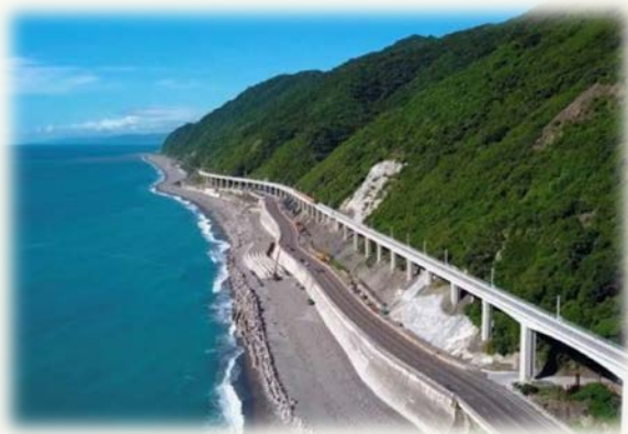
臺鐵南迴鐵路電氣化工程