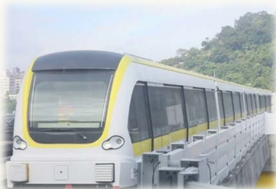
臺北捷運環狀線 (第1階段)