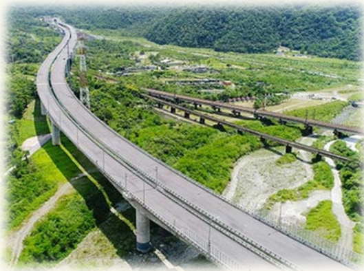
台9線蘇花公路改善