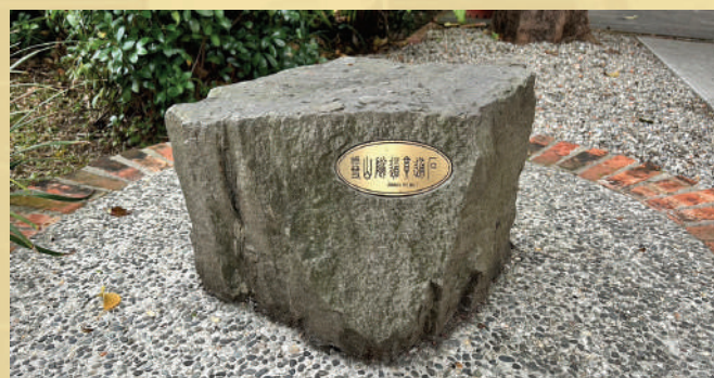
「雪山隧道貫通石」是2004年9月16日隧道打通時最大且最關鍵的一顆貫通石，在游錫堃擔任閣揆時期，收藏在金華街院長官邸，後來移轉到了行政院區，民間流傳這塊石頭具有神奇的力量，可以帶來好運。