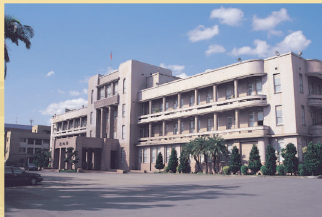
大樓立面為平屋頂，與古典的希臘三角頂大異其趣，中央入口每一層都有一對線條簡潔的柱子，底層為方柱，第二層為變體柱，第三層為菱形柱。