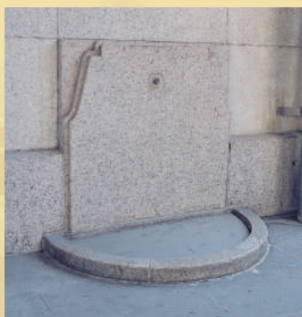
北面入口尚存的洗塵水龍頭座，提供來訪者及汽車洗滌之用。