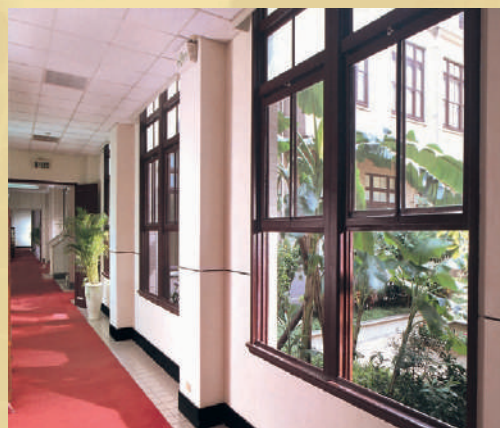
木製的平衡錘拉窗可使窗子停留在任何高度，為簡單、方便的設計。