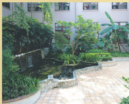
大樓中庭在建造之初係規劃作為停車場，目前已廣植花木，形成氣氛優雅寧靜的小花園。