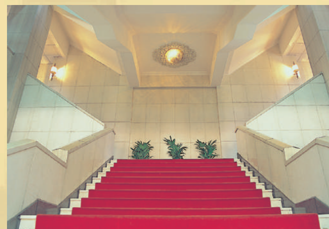
入口大廳的大樓梯，扶手及牆壁的石片為近年所置，色澤明亮而親切。