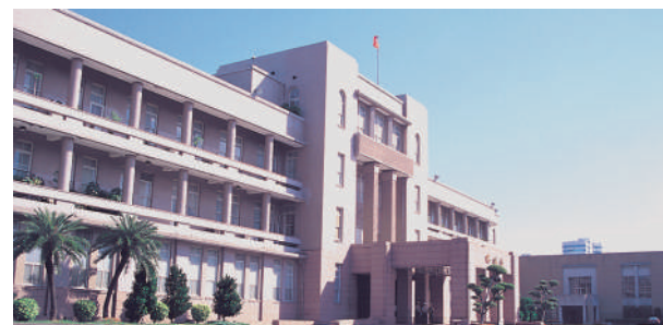
從西南角望行政院大樓，對稱式的佈局，線條簡潔而流暢，是典型的現代主義風格。