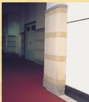
內牆以不同色澤的磨石子板，嵌入牆面及柱面，形成水平橫帶。