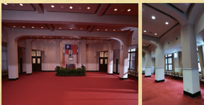
大禮堂上空採用大跨距鋼鐵桁架，是當時最進步的構造。