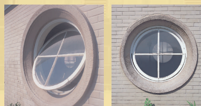
牛眼窗的開窗方式為上下推，又稱為點頭窗或搖頭窗，從立面牆開口，是饒富趣味的設計。