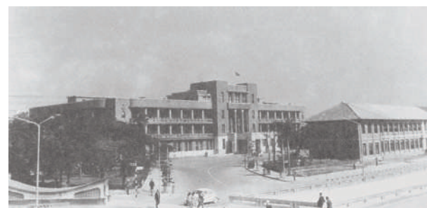
民國六十二年時的行政院外觀，前棟建築為日據時期樺山尋常小學校教室，早期曾做為前新聞局辦公室。

清光緒二十年(1895)臺灣受日本統治，日本逐步在臺北實施都市計畫，拆除臺北府城城牆。其中二次較大規模的公共建築計畫，城內及城東新規劃的街廓多提供作為公共建築、機關建築及學校用地。在第二次都市建設行動中，選定了位於臺北府城東北角的樺山町，做為臺北市役所所址。