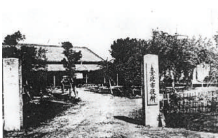
臺北市役所暫用樺山尋常小學校時期。(臺北市發展史《二》1982)

行政院主體建築在日據時期昭和十二年(1937)興建，民國八十七年(1998)七月三十日經內政部指定公告為古蹟。指定古蹟的理由：(1)日據時期為臺北市役所，臺灣光復後，先後供臺灣省行政長官公署、臺灣省政府、行政院等機關使用，甚具歷史意義。(2)為日據後期臺灣現代主義建築風格重要作品之一。