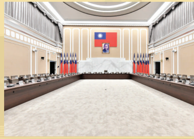
第一會議室（院會室）空間寬敞，天花板高度達九公尺，跨距達二十四公尺。