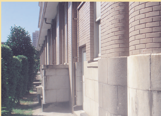
外牆下半段為石造臺基，上半段貼褐色二丁掛瓷磚，當時稱為國防色面磚，具防空保護作用。