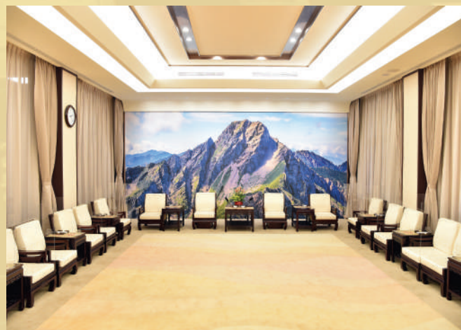
玉山廳為院長接見重要賓客的地點，陳設以呼應「向山致敬、向海致敬」政策為主題，主牆面懸掛青翠堅拔的玉山，鋪設婆娑浪紋地毯猶如環抱島嶼的海洋。