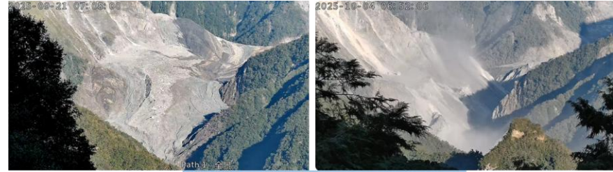
壩體溢流破壞前後比對

依據10月6日中央災害應變中心專家會議，陽明交通大學、臺灣大學、成功大學團隊討論獲致共識：