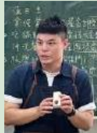
丹麥家具產業見學： 家具設計製造與木材 利用的關聯探究