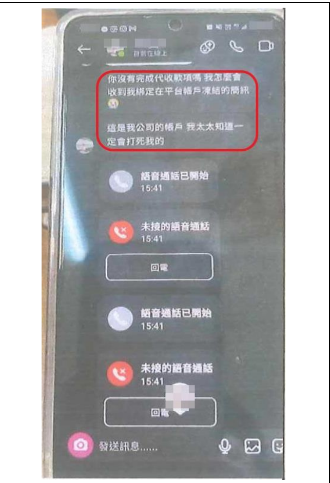
圖 2 - 佯稱被害人未經代收款項驗證，導致無法使用帳戶，揚言要對被害人提告。