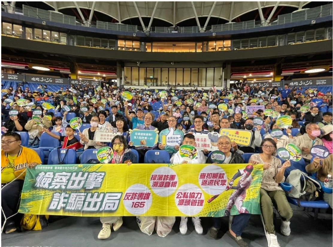
「檢察出擊、詐騙出局」反詐宣導活動，工作人員、與會球迷大合影。