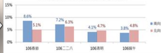
圖5南港系統-蘇澳旅行時間預測平均絕對誤差