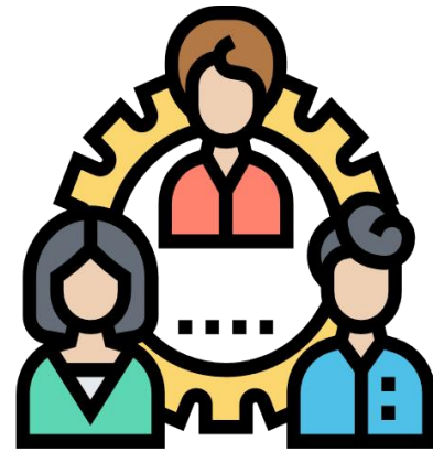
設立原語會及16族 語推組織