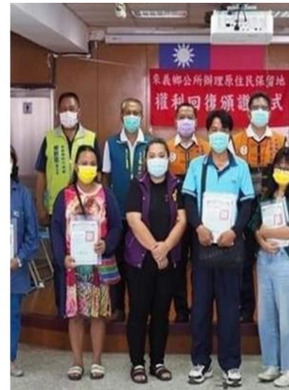
解決屏東縣來 義電塔40餘年 土地補償問題