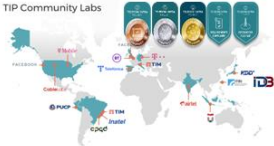
TIP Community Labs