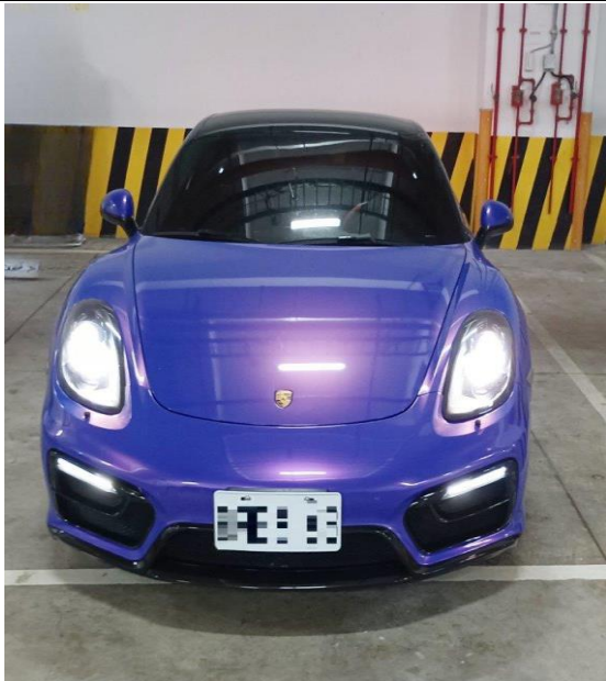
▲桃園地檢署查扣之亮紫色保時捷跑車