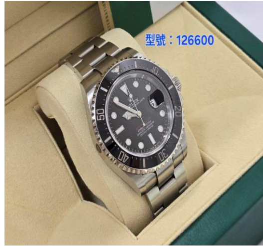
▲臺北地檢署查扣之勞力士錶-3