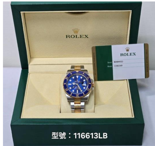
▲臺北地檢署查扣之勞力士錶-1