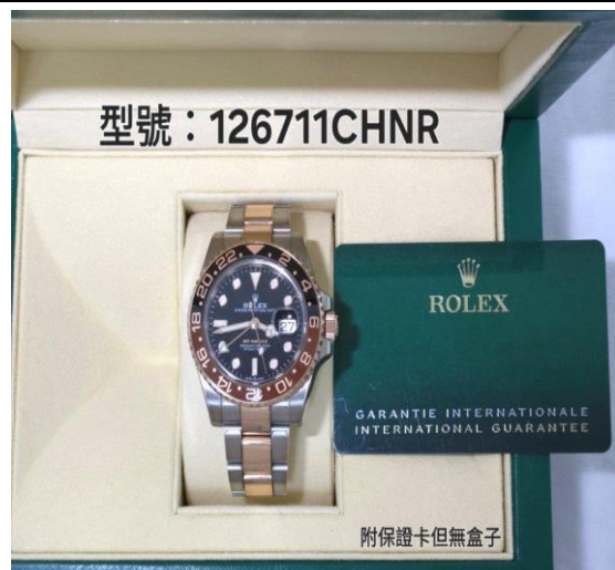
▲臺北地檢署查扣之勞力士錶-2