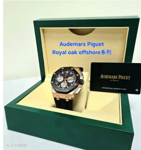
▲臺北地檢署查扣之愛彼(Audemars Piguet)錶