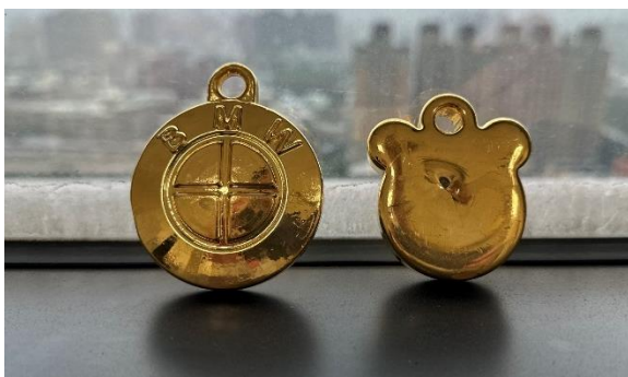
▲黃金墜子(BMW 標誌形狀及米奇形狀各