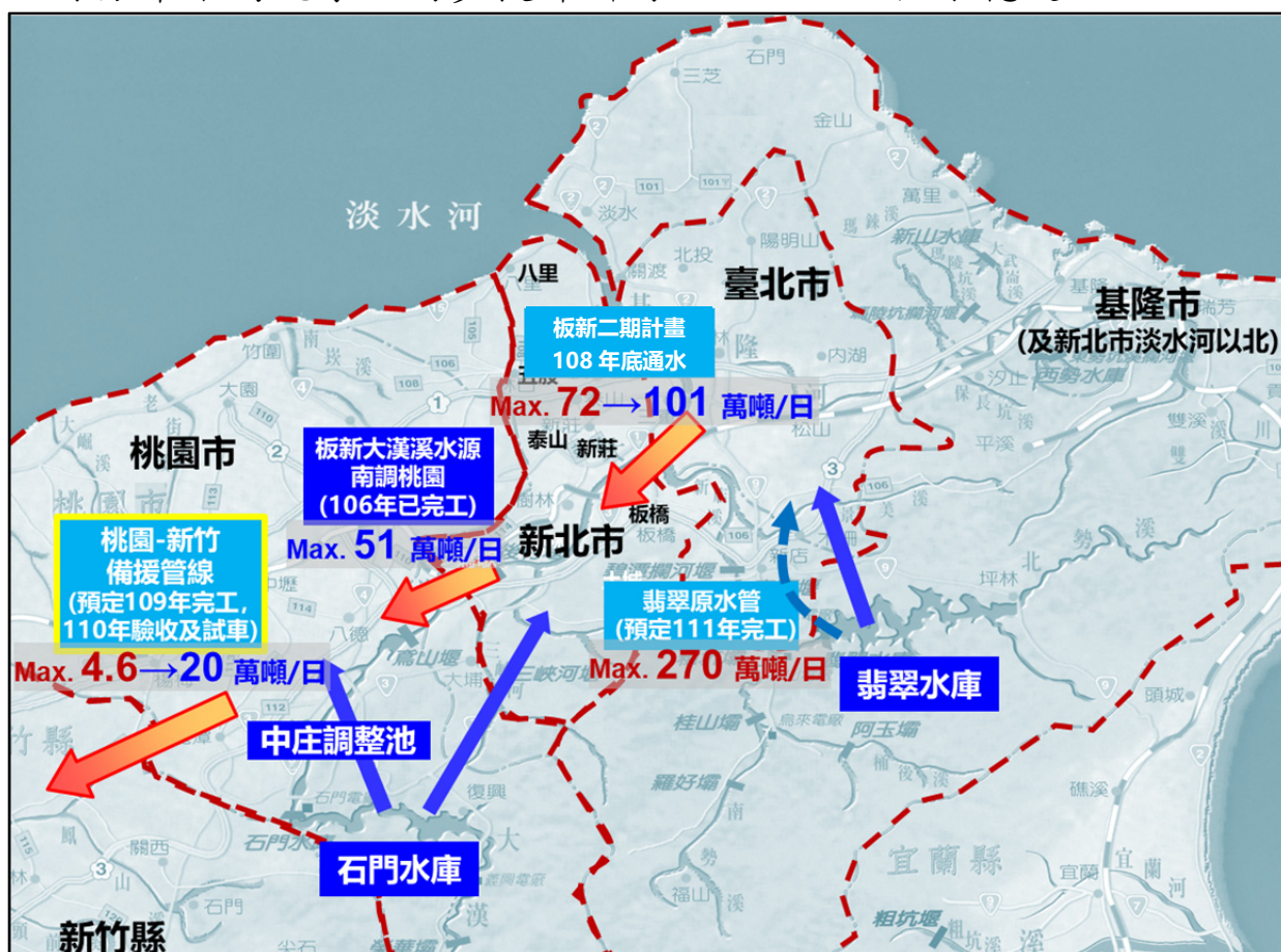
圖 2-1 北部區域北水南調示意圖

經考量北部區域整體水文條件及水資源設施，採「北水南調」為供水策略，目前板新地區用水需求為每日 82 萬噸，主要水源來自大漢溪，「板新地區供水改善計畫」於 108 年底正式通水後，新店溪翡翠水庫水源可擴大支援板新地區用水，原石門水庫供應板新地區之水源即可回供桃園地區，大幅提升桃園地區之供水穩定。配合原核定「桃園-新竹備援管線工程計畫」，可在不影響桃園供水穩定度下，靈活調度區域水源(詳圖 2-1)，以改善北部區域水源分布不均現象，同步提升新竹以北地區之供水穩定。