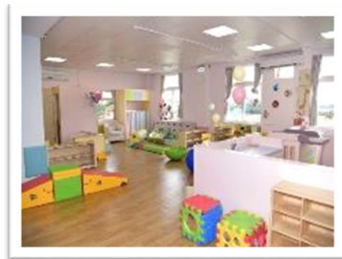
桃園市富竹托育家園