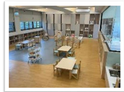
新竹市香山托育家園