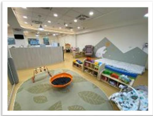
高雄市旗津托育家園