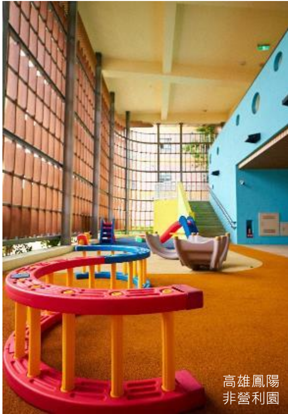
高雄鳳陽 非營利園

✓ 公立、非營利、準公共幼兒園合計就學名額由2016年18.3萬→2021年43.8萬個名額，約增加25.5萬名