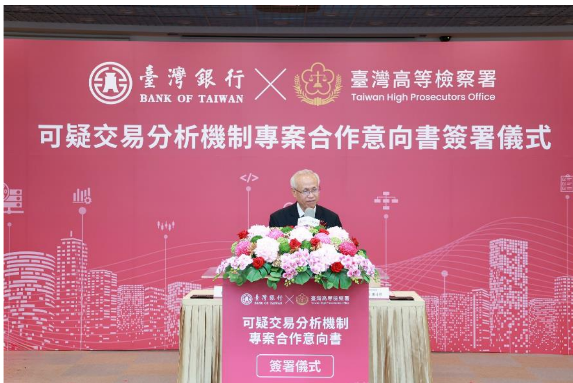
臺高檢署張斗輝檢察長致詞