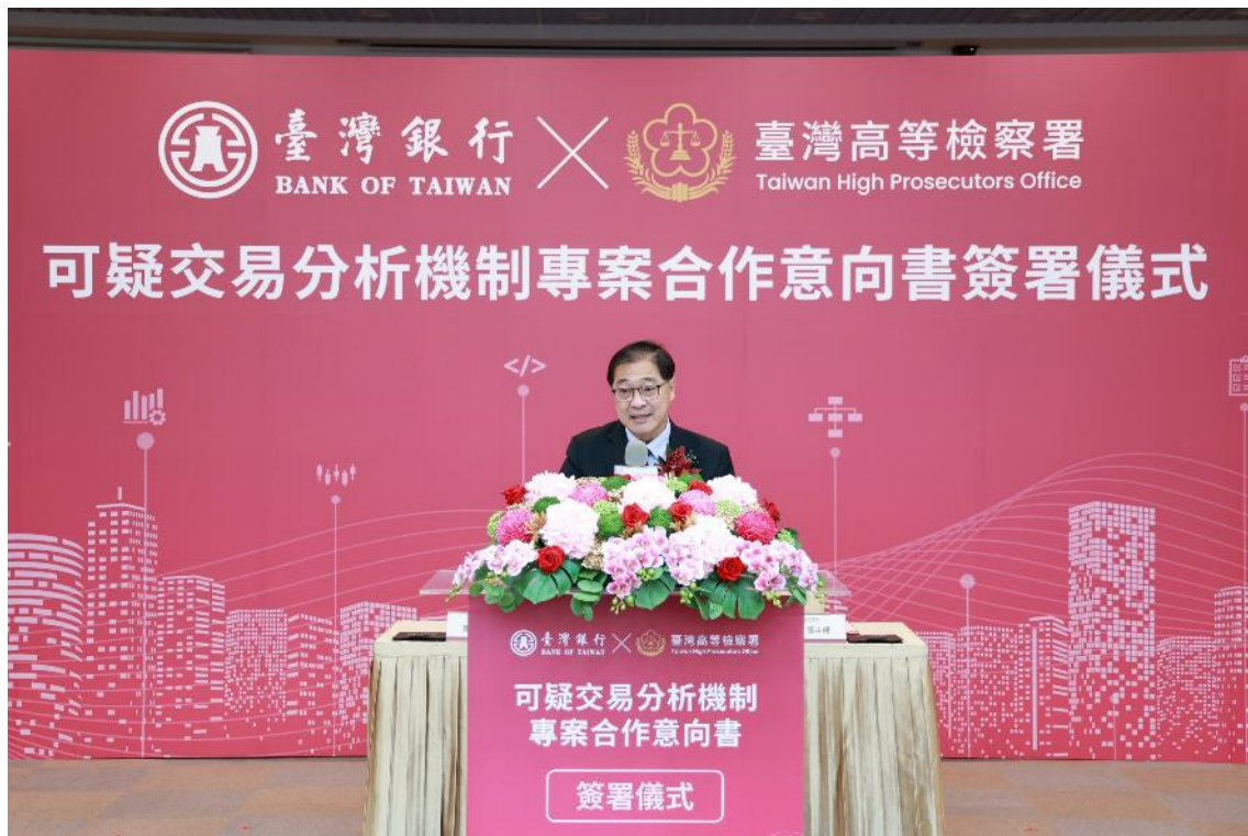
法務部鄭銘謙部長致詞勉勵