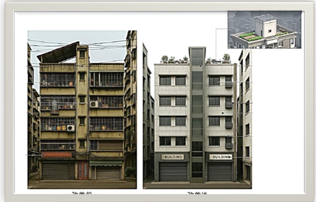
老舊公寓修繕前後模擬示意圖