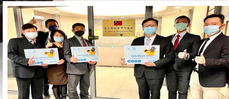
駐立陶宛 台灣代表處成立