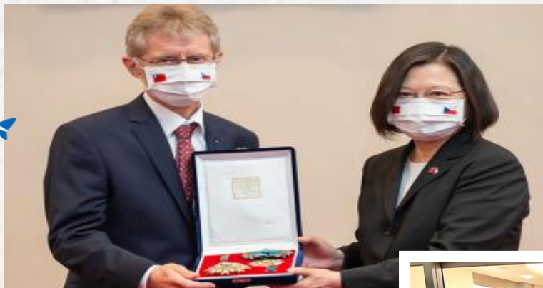
捷克參議院議長韋德齊 不畏打壓 率團訪台