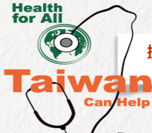
台灣捐贈醫療物資