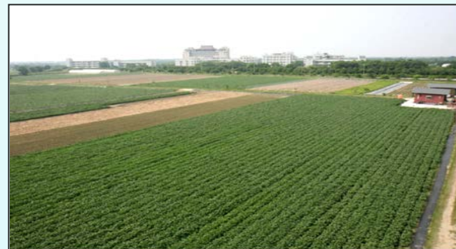
福智麻園農場有機集團栽培區