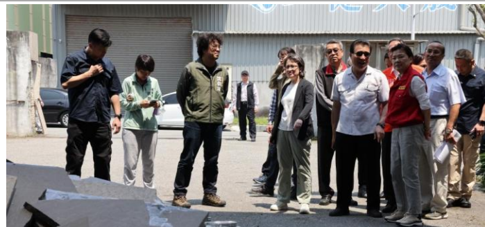
部長及蕭大使於地震隔日立即到現場關懷受災廠商