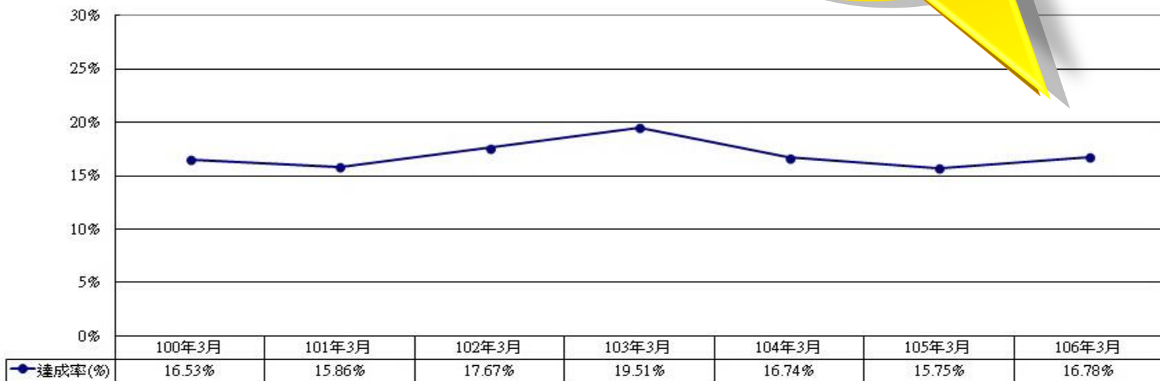
100~106各年度截至3月底 整體預算達成率比較圖

截至106年3月底， 整體預算達成率 16.78%，高於 105年同期之 15.75%。