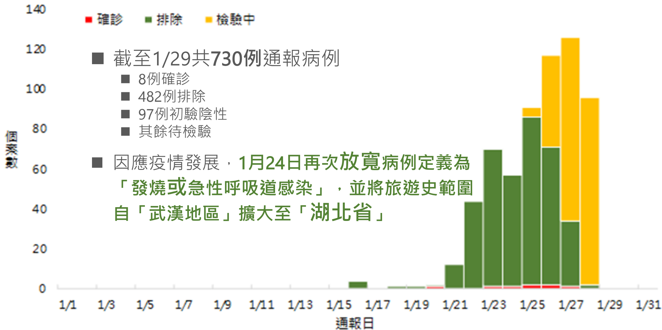
嚴重特殊傳染性肺炎通報個案趨勢圖