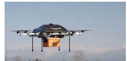
美國amazon以無人機配送