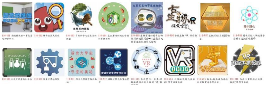
圖 1：教育部 VR 教學應用教材

持續以十二年國民基本教育課程綱要為範圍，開發可融入課程教學使用的 VR 教材，提升中小學教師之新科技認知，學生透過 VR 教材之沉浸式互動，進行探索與模擬體驗，以幫助提升學生理解與學習效果。110 年共補助 16 件 VR 教材計 107 單元，111 年共補助 14 件 VR 教材計 91 單元，教材透過專家學者審查後放置於教育雲(教育大市集)，以創用 CC 方式提供全國教師免費下載使用，每件教材備有教材軟體操作說明、教案及學習單，以利教師運用 VR 教材於教學現場。