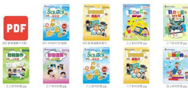
圖 4：國小資訊教育教材

依據國家教育研究院 109 年 6 月發布之「國民小學科技教育及資訊教育課程發展參考說明」，發展資訊教育參考教材，以利中小課程銜接。教材內容著重運算思維、虛擬實境(VR)、人工智慧、物聯網、數位自造等生活應用內涵，可供體驗學習、自主學習、線上學習、專題導向學習(PBL)等使用，培養數位公民素養。編製國小 3-6 年級 8 冊資訊教育參考教材(包括數位內容及影片)，110-111 年完成數位教材影片共 241 部，並上傳教育部教育雲。