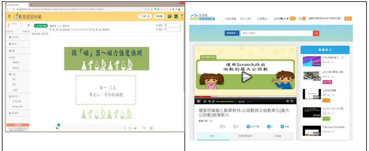
圖 2：運算思維教材-自然及數學領域