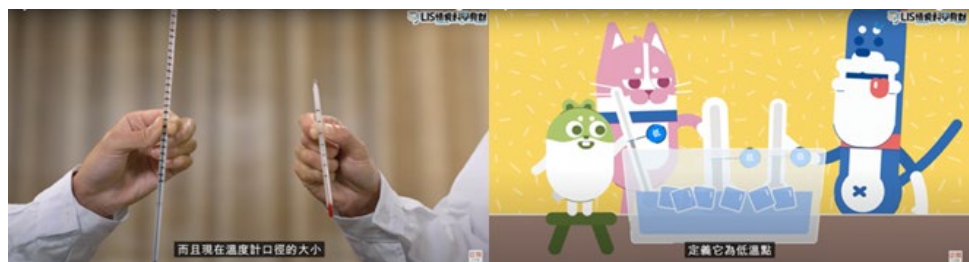
圖 6：LIS 情境科學教材

以科學史為主題，開發地球科學及理化之教學影片教材，讓學生學習科學素養。以科學推理架構，包括發現、聯想、假設、驗證、結論 5 步驟，來呈現教材設計，可做為十二年國教課綱學生進行探究思考學習的良好教材。已新增產出科學影片教材共 48 組(理化科學史 24 組、地科科學史 24 組)，含影片、學習單上傳教育雲平臺，且於粉絲專頁發文宣傳。