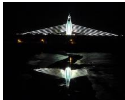
彰化王功 後港溪脊背橋 橋塔為鳥體，鋼索為羽翼 呈現大杓鷗造型