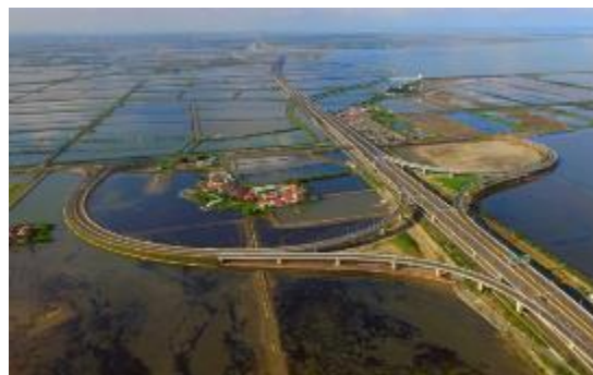
臺南七股 七股交流道 融入鹽田環境 加大圓弧避開村落