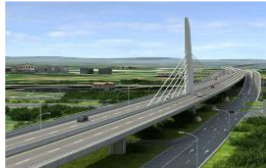
桃園永安 斜塔脊背橋 高桅長纜 揚帆破海