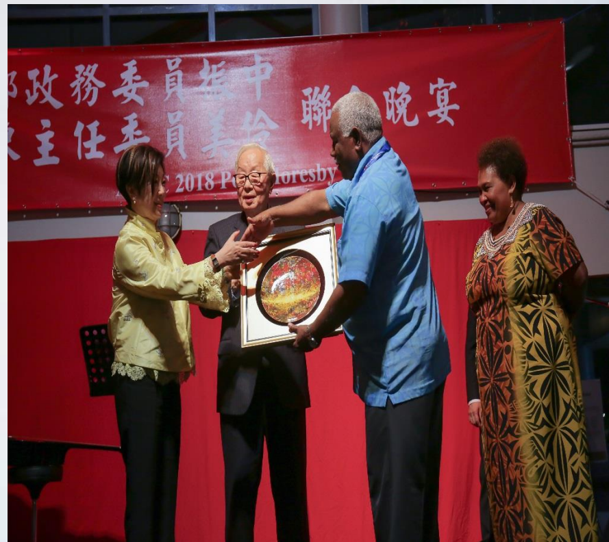
我國張領袖代表與太平洋島國友邦元首合影