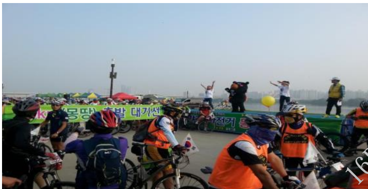
參加漢江自行車節，推廣「臺灣自行車節」