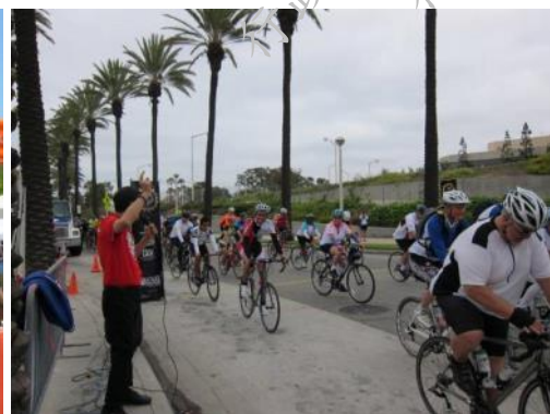
洛杉磯郡沿河自行車環遊活動