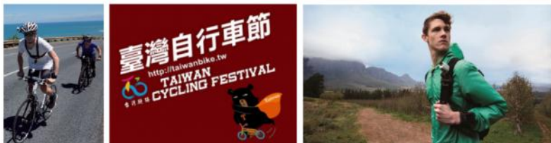
Sony Action Cam 運動攝影機合作企劃案 交通部觀光局- 2015 自行車節