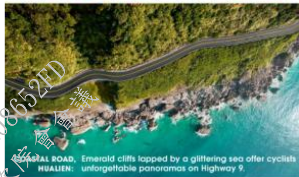
SEAFOOD ROAD. Emerald cliffs lapped by a glittering sea offer cyclists HUALIEN: unforgettable panoramas on Highway 9.

Taiwan Tourism Bureau is now offering an incredible touring package for all types of riders from beginners to hard core cyclists.