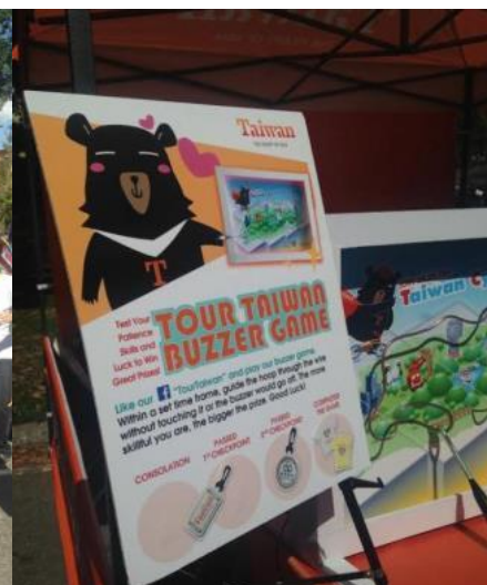
紐約中央公園「世紀騎乘」