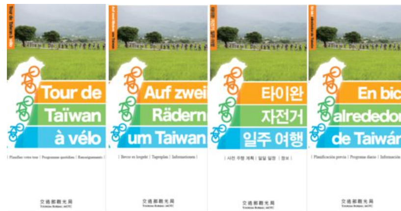
Planifiez votre tour | Programme quotidien | Equipement |