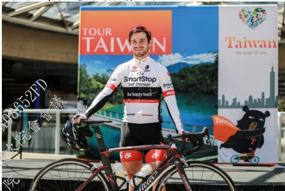
舉辦溫哥華大型單車推廣活動