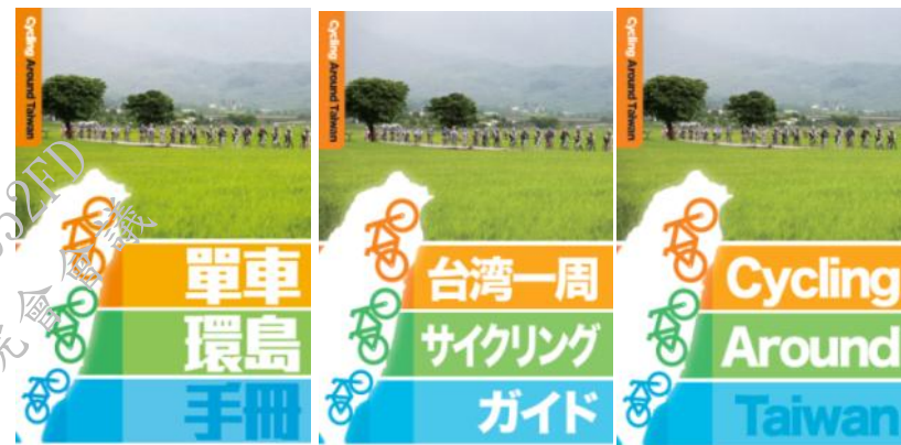
行前規劃 | 各天行程 | 環島資訊 |