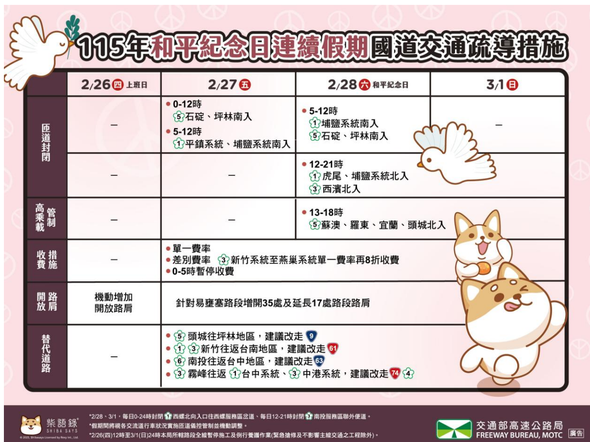
圖 2、和平紀念日連續假期國道交通疏導措施