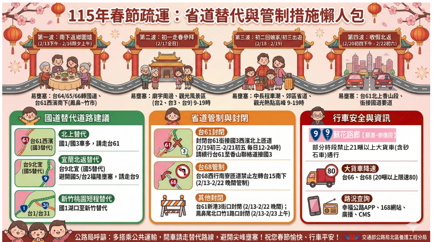
圖 3、省道宣導及管制措施