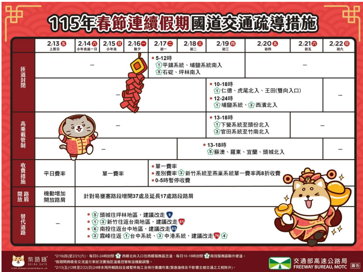
圖 1、春節連續假期國道交通疏導措施