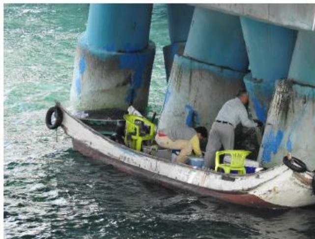
港內漁船、釣客佈網捕魚