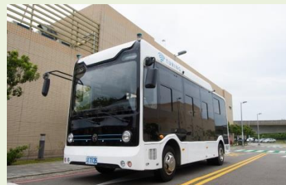
桃園青埔自駕巴士