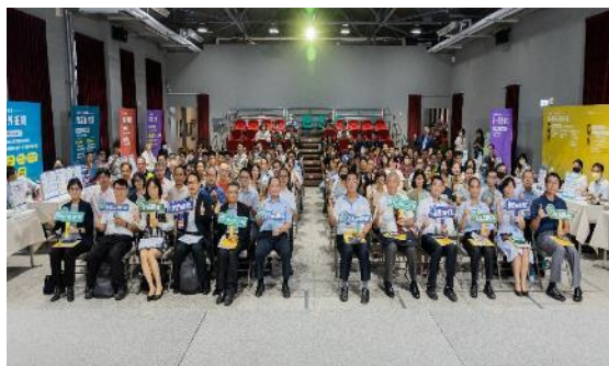
宜蘭場聯合說明會

已辦理北中南東區 6 場次大型說明會，製造業、商業服務業、街區店家及夜市市場業者共 2,490 人參加