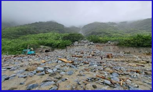
K53+800 西正線小清水溪橋沖毀