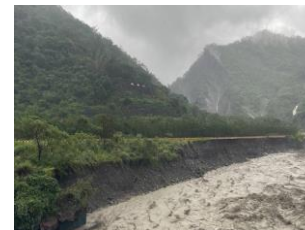
15k+150 路基流失250m 8/1搶通