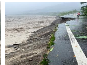
11k+150 路基流失200m 7/30搶通