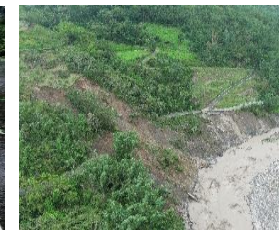
4k+500 路基流失500m 預計8/7搶通

搶通策略：那瑪夏居民暫由嘉129-1線，銜接嘉129線，再接台3線大埔後進行脫困！（無孤島效應） 搶修機具已進入災區，由那瑪夏端（北）及甲仙端（南）兩端分進辦理搶通作業中，搶救節奏如下：