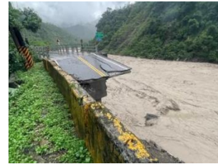
15k+900 路基流失30m 預計8/2搶通