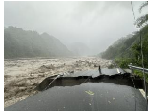
17k+500 路基流失500m 預計8/4搶通