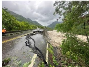
21k+200 路基流失200m 預計8/10搶通