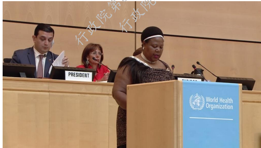
史瓦濟蘭衛生部長為我發聲