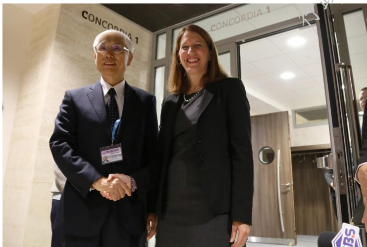
美國衛生部長 Sylvia Mathews Burwell