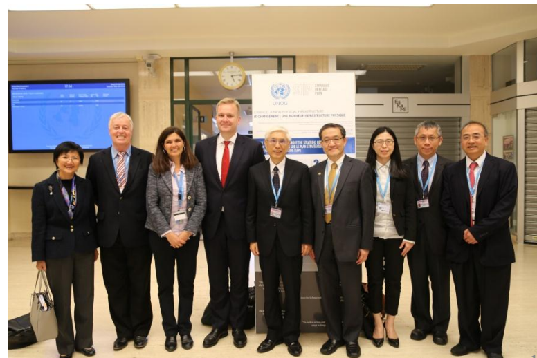
歐盟駐聯合國代表團