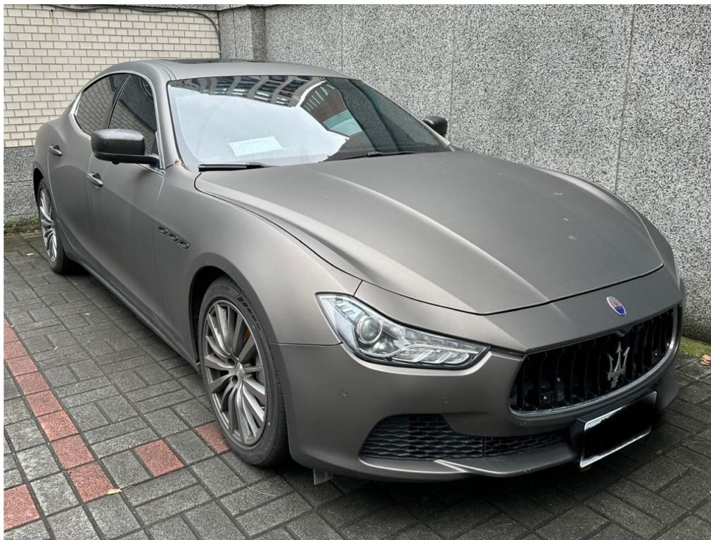
扣押之瑪莎拉蒂廠牌汽車