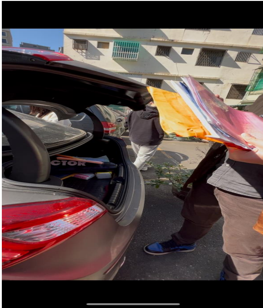
柯男使用之車輛及相關合約