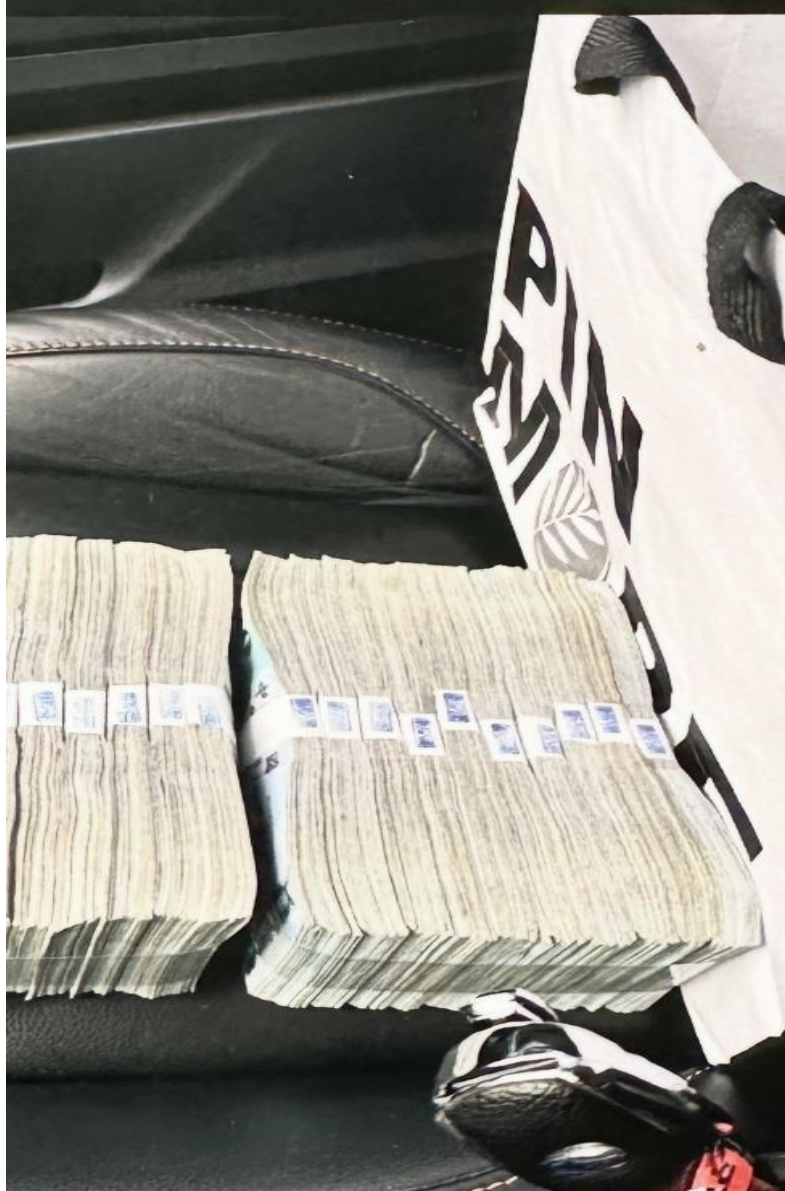
柯男仲介不動產抵押借貸之鉅額現金