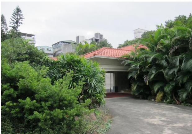
官邸主建築及庭院

(二)網站服務黑客松：以「公開資料創新社企服務應用」與「創建台灣社企入口網」為主題，媒合社企與科技社群，密集激盪出執行性高的創新方案。